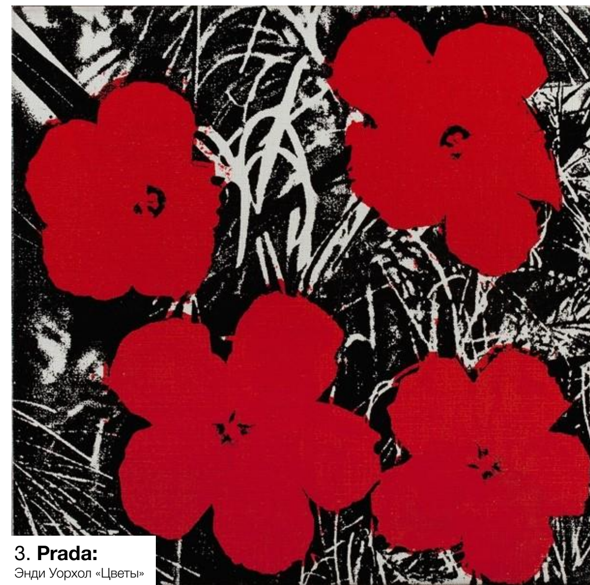
3. Prada: Энди Уорхол «Цветы»