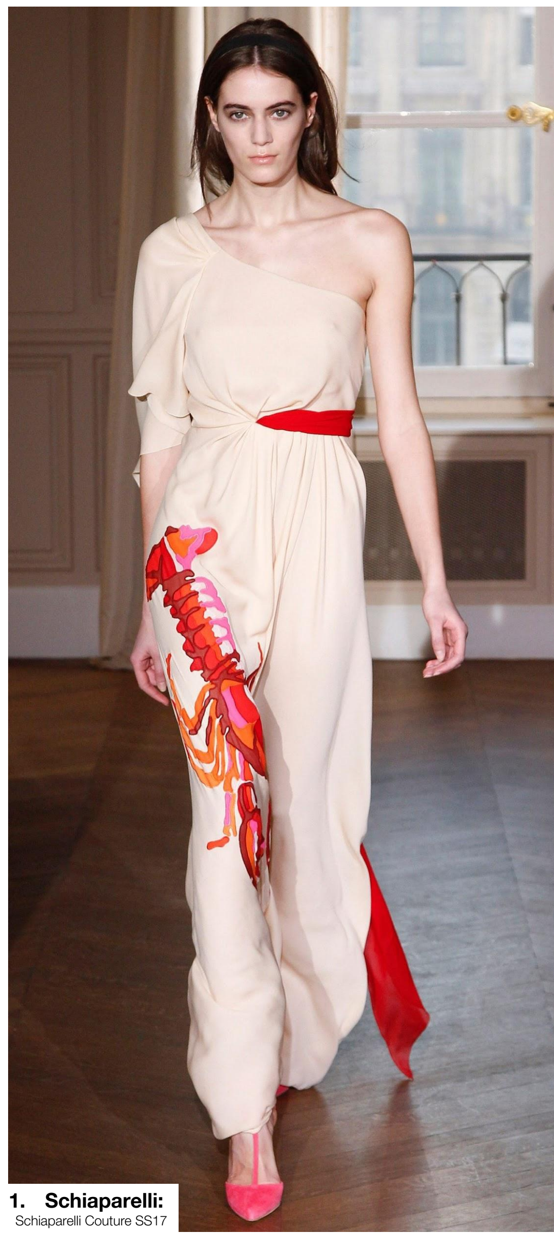
1. Schiaparelli: Schiaparelli Couture SS17