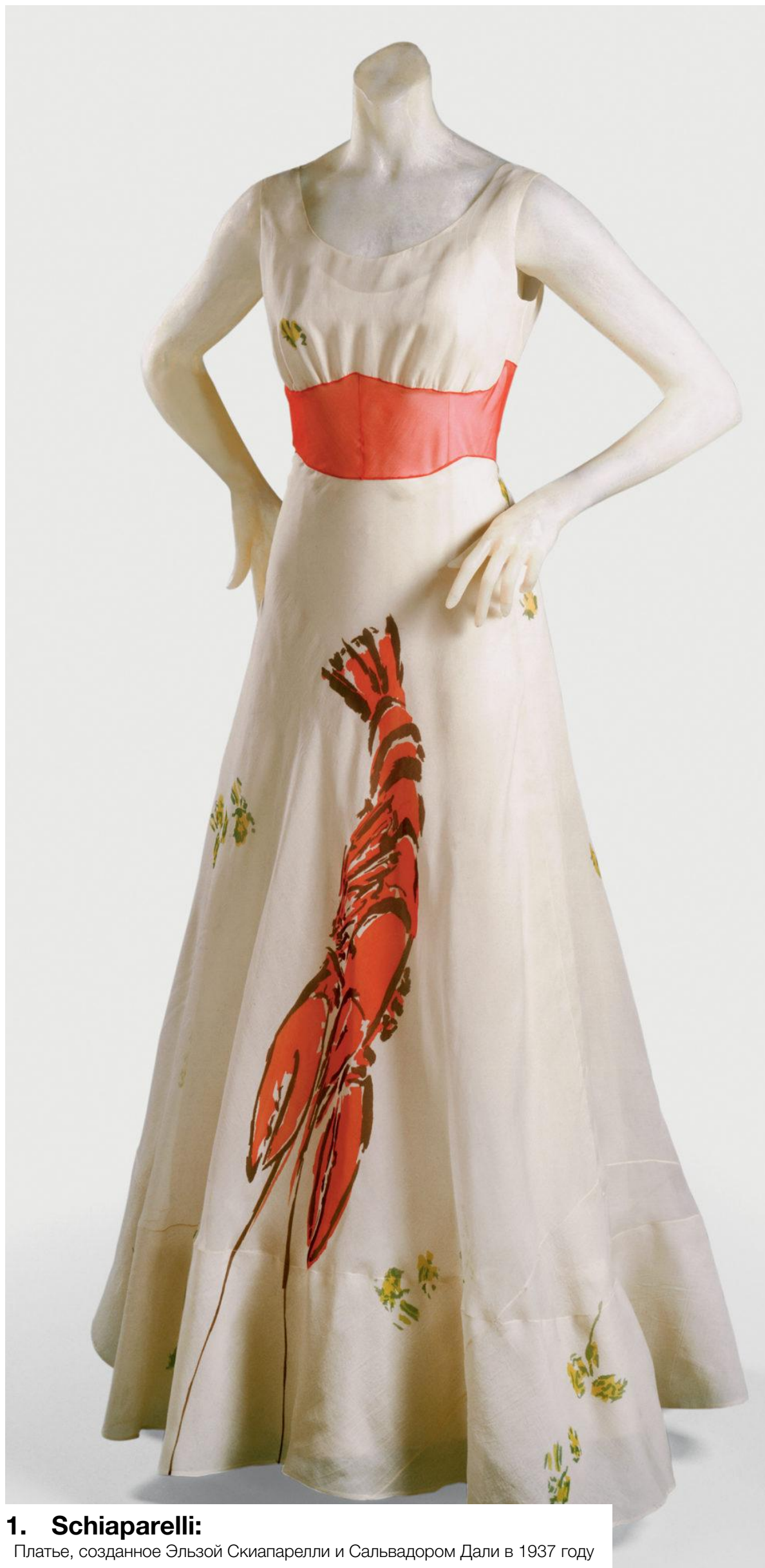
1. Schiaparelli: Платье, созданное Эльзой Скиапарелли и Сальвадором Дали в 1937 году